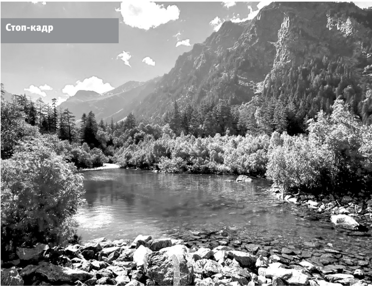
Бадукские озера — достопримечательность Тебердинского национального парка