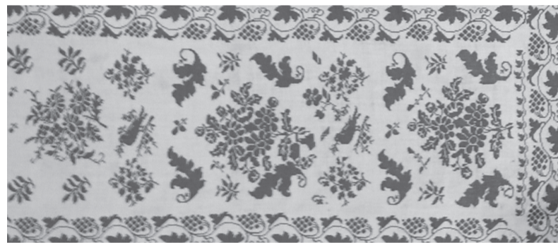
Рушник из нашего музея